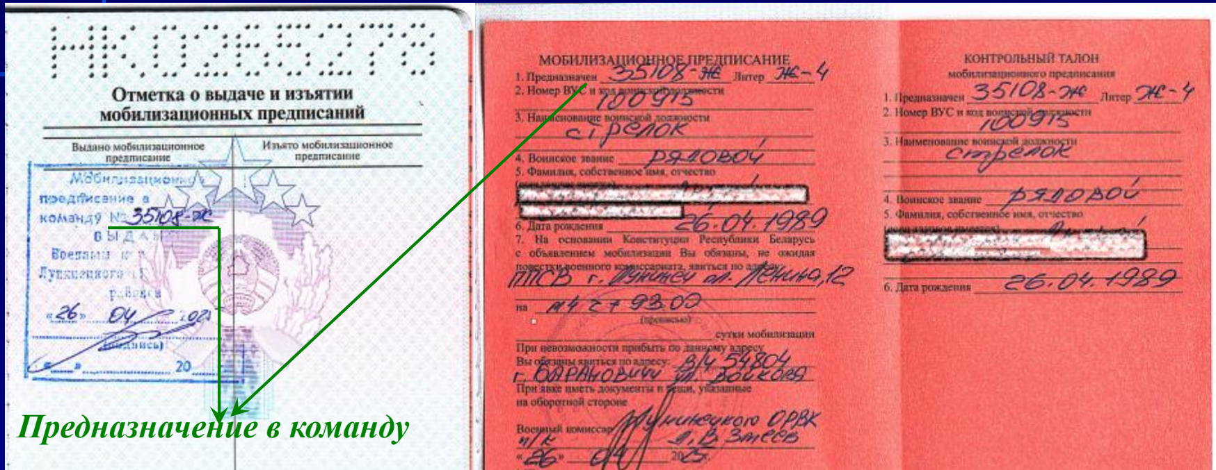
Оборотная сторона личной карточки

При предназначении военнообязанного в команду (партию), в военном билете делается соответствующая отметка на странице «отметка о выдаче и изъятии мобилизационных предписаний», а также клеивается само мобилизационное предписание, где указаны: номер команды, куда и в какое время военнообязанный должен прибыть в случае мобилизации. Номер команды переносится в раздел Особые отметки личной карточки